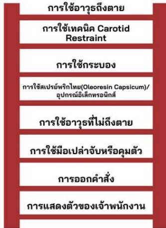
รูปภาพที่ ๓ ตัวแบบระดับการใช้กำลังแบบขั้นบันได (Ladder Model)

ต่อมาในปี ๑๙๙๙ สมาคมหัวหน้าตำรวจแห่งแคนาดา (Canadian Association of Chiefs of Police; CACP) ได้พัฒนาให้ตัวแบบระดับการใช้กำลังเป็นภาพวงล้อแทนแบบขั้นบันไดตามภาพที่ ๓ เรียกว่า “ตัวแบบระดับการใช้กำลังแบบวงล้อ”(Wheel Model) เพื่อความง่ายและตรงกับข้อเท็จจริง ที่ว่าคนร้ายไม่ได้เริ่มต้นที่จะให้ความร่วมมือกับเจ้าพนักงานหรือยอมทำตามที่เจ้าพนักงานสั่ง โดยเมื่อเริ่มเกิดเหตุหรือเมื่อเจ้าพนักงานไปถึงที่เกิดเหตุแล้ว คนร้ายอาจเริ่มใช้ความรุนแรงตั้งแต่ต้นก็ได้ โดยนำหลักคิดจากคำพิพากษาศาลสูงสหรัฐอเมริกา คดีระหว่างแกรแฮมกับ