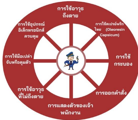
รูปภาพที่ ๔ ตัวแบบระดับการใช้กำลังแบบวงกลมการตอบสนองการต่อต้านแบบพลวัต (Dynamic Resistance-Response Model = DRM)